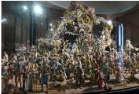
Il presepe napoletano della Reggia di Caserta, del 1700.