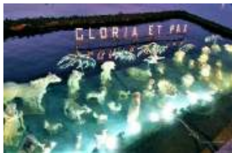
Presepe sommerso di Laveno Mombello

Allo stesso periodo risale il presepe di Santa Maria Maggiore a Roma , scolpito da Arnolfo di Cambio nel 1289.