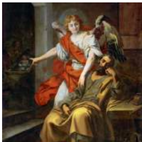
"Il sogno di Giuseppe", uno degli episodi presenti nel Vangelo di Matteo. D. Crespi.

Il Vangelo di Giovanni, scritto quando i sinottici erano già abbastanza conosciuti, omette la narrazione della natività, sostituendola con un grandioso Prologo nel quale il Cristo è identificato con il Logos, per mezzo del quale "tutte le opere sono state create". Tale interpretazione permette di considerare il Natale come una seconda creazione, nella quale il Logos "si è fatto carne e ha posto la sua tenda in mezzo a noi"; se dunque nella Genesi Dio crea l'uomo "a sua immagine", nell'incarnazione assume la natura umana scegliendo di condividerla in ogni suo aspetto, dalla nascita alla morte, tranne che nel peccato.