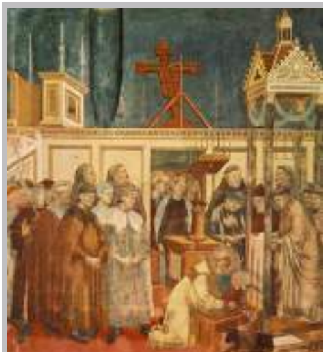
Il Presepe di Greccio è la tredicesima delle ventotto scene del ciclo di affreschi delle Storie di san Francesco della basilica superiore di Assisi, attribuiti a Giotto. Fu dipinta verosimilmente tra il 1295 e il 1299.