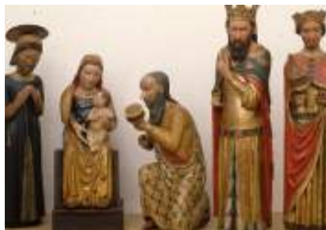
Il presepio della Basilica di Santo Stefano a Bologna, 1980.

Il primo presepe scolpito a tutto tondo di cui si abbia notizia si trova a Bologna nella Basilica di Santo Stefano; l'autore dell'opera, realizzata verso la fine del XIII sec., ha il nome convenzionale di Maestro del Crocifisso .