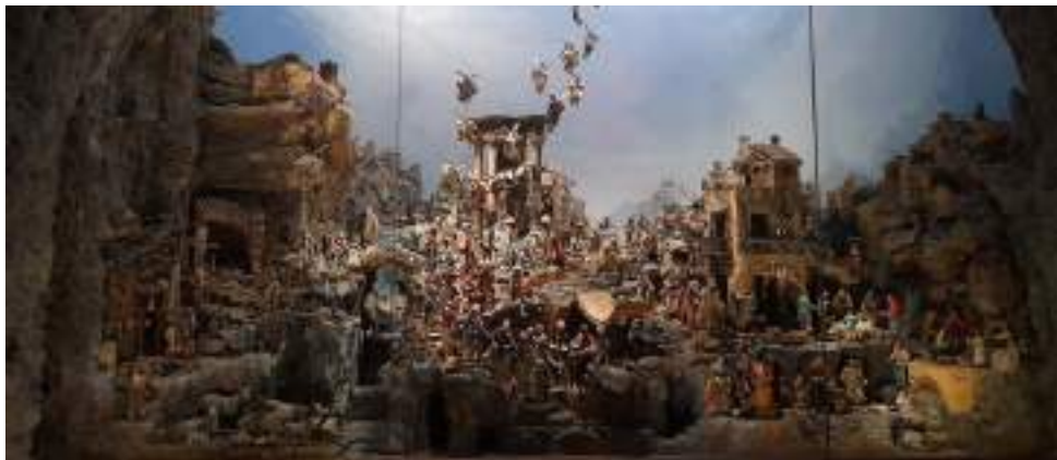
Presepe Cuciniello, al Museo nazionale di San Martino di Napoli.