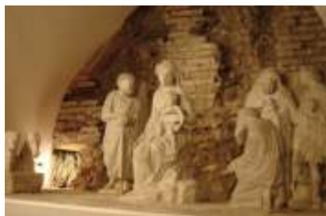
Presepe di Santa Maria Maggiore, Roma.