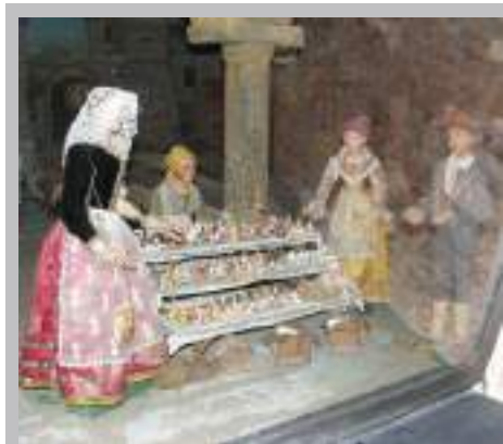
Presepe genovese. Questa scena - ricavata a nicchia da un più vasto presepe di ambientazione genovese fra Seicento e Settecento - ha in sé una singolare autocitazione: raffigura, infatti, un gruppo di popolane intente a vendere materiali per realizzare presepi.

I presepi più corretti dal punto di vista storico sono di ambientazione antica, con la riproduzione di un villaggio rurale di epoca romana; tuttavia, poiché il significato del Natale è universale, sono consentite anche interpretazioni più recenti e personali. Fra le varianti regionali, il presepe napoletano è senz'altro il più famoso, tanto che via San Gregorio Armeno, detta anche via dei presepi , è un punto di riferimento imprescindibile per gli amanti del genere;