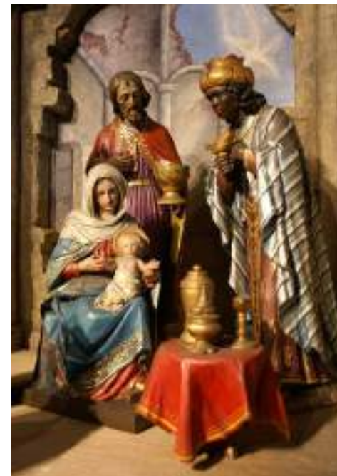
Un presepio gardenese.

Le statuine vengono posizionate in momenti diversi, che seguono la liturgia: Maria e Giuseppe arrivano la sera della vigilia, mentre il Bambino si aggiunge dopo la messa di mezzanotte; nei giorni seguenti si inseriscono i Magi, che possono essere spostati progressivamente fino al giorno dell'Epifania.